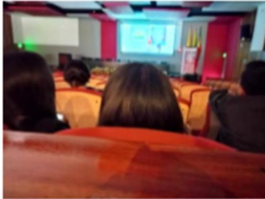
Proyección en Universidad de Nariño 14-10-2022