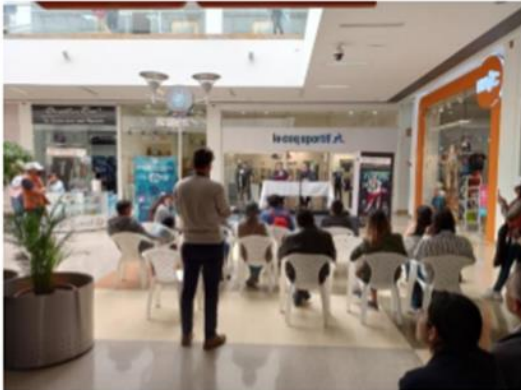
Rueda de prensa- 11-10-22 – C.C Unicentro