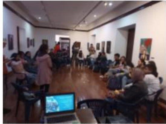
Encuentro de productoras, 13-10-22 Casa de la Cultura