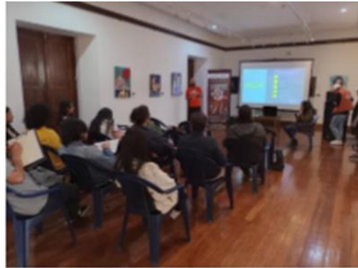
Ponencia 1 – seminario el Cine en mil palabras Casa de la cultura – 12-10-22