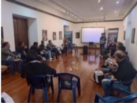
Foro: exhibición audiovisual en Nariño Casa de la Cultura – 13-10-22