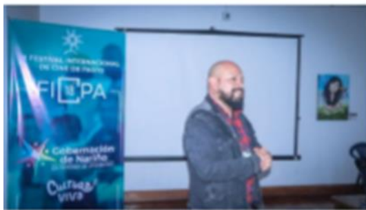
Ponencia 5, cine en mil palabras Casa de la Cultura 14-10-2022