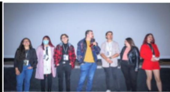
Maratón Cámaras de Barniz – 15-10-2022 , Teatro Colombia