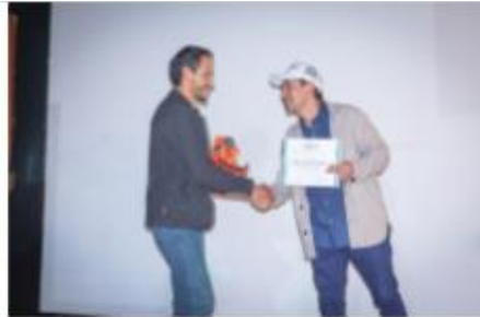
Premiación , Teatro Colombia , 15-10-2022