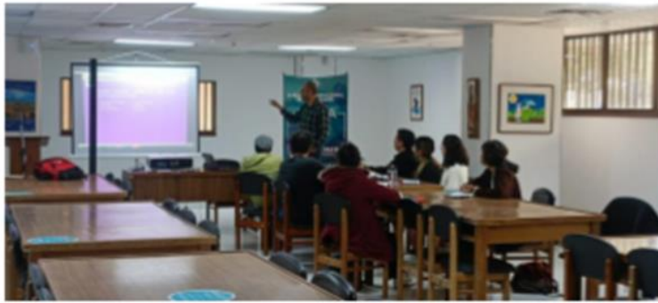
Taller de Guión – 12,13 y 14 octubre de 2022, Banco de la república