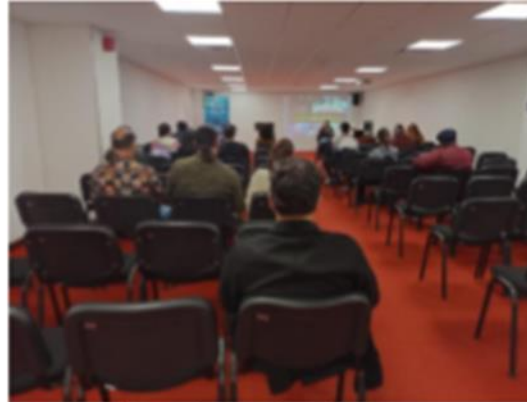
Master Class de Producción Banco de la República – 14-10-2022