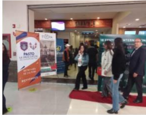
Ingreso Alfombra roja inauguración – 11-10-22 Cinemark – C.C Unicentro