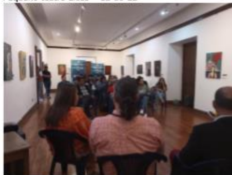
Foro: Hacer Cine y no morir en el intento - 12-11-22 Casa de la cultura - 12-10-22