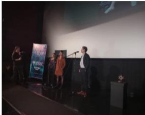
Acto inaugural – 11-10-22 – Cinemark