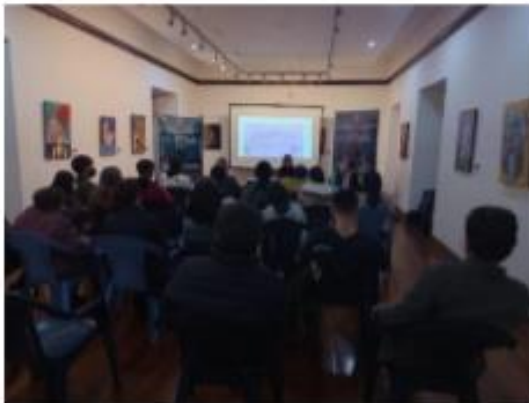
Ponencia 4. Cine en mil palabras, 13-10-22 Casa de la Cultura