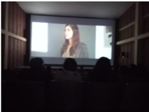
Proyección de producciones audiovisuales 12-10-22, Teatro Colombia