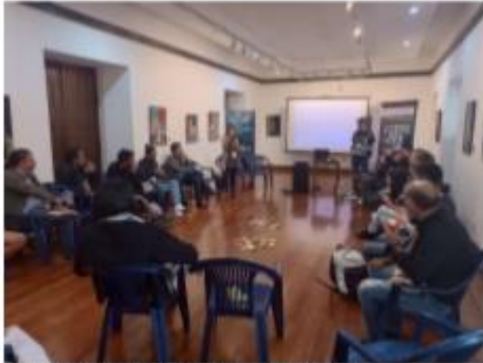
Foro: exhibición audiovisual en Nariño Casa de la Cultura – 13-10-22