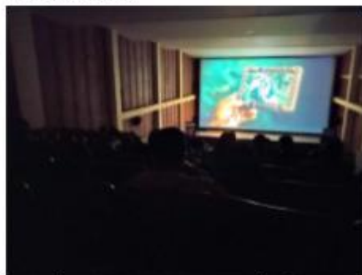
Proyección de producciones audiovisuales 13-10-22, Teatro Colombia