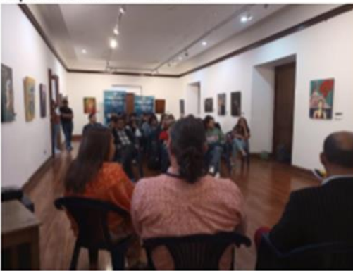
Foro: Hacer Cine y no morir en el intento – 12-11-22 Casa de la cultura – 12-10-22