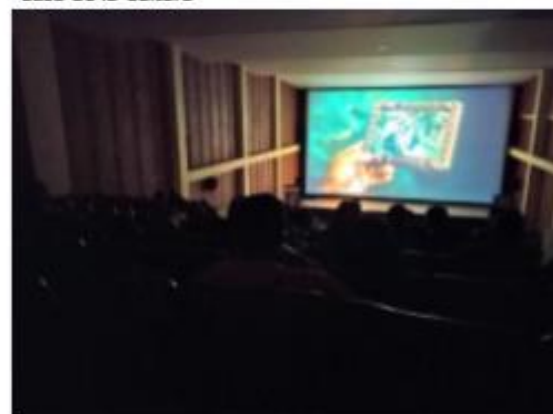
Proyección de producciones audiovisuales 13-10-22, Teatro Colombia