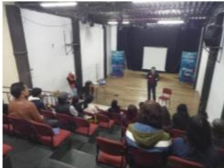
Master class de actuación con Ernesto Benjumea Pequeño teatro Liceo - 12-10-22