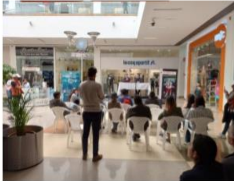
Rueda de prensa- 11-10-22 – C.C Unicentro