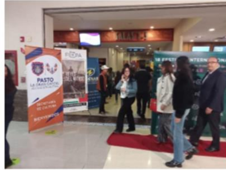
Ingreso Alfombra roja inauguración – 11-10-22 Cinemark – C.C Unicentro