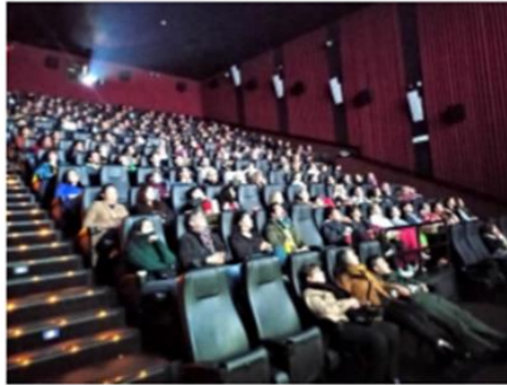
Proyección película inaugural – 11-10-22 Cinemark