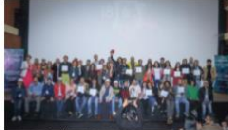
Premiación, ganadores y equipo FICPA , Teatro Colombia, 15-10-2022