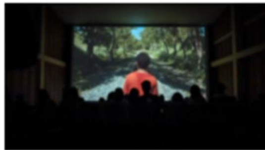
Proyección películas , Teatro Colombia 14-10-2022