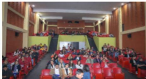
Proyección de Cortometrajes nariñenses y Noche de Cine nariñense