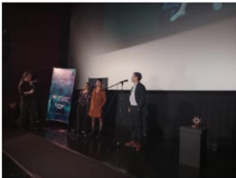
Acto inaugural – 11-10-22 – Cinemark