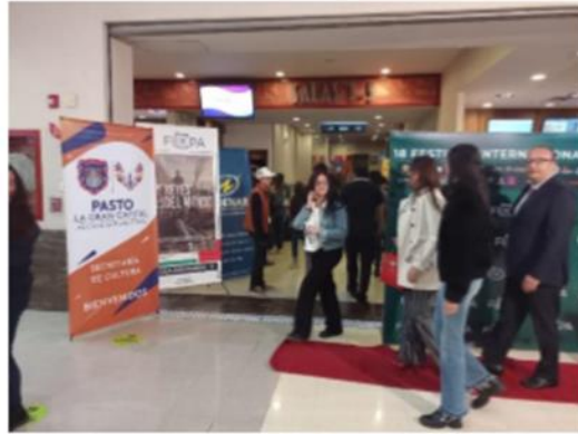
Ingreso Alfombra roja inauguración – 11-10-22 Cinemark – C.C Unicentro