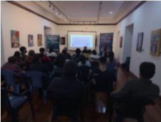
Ponencia 4. Cine en mil palabras, 13-10-22 Casa de la Cultura