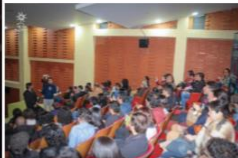
Proyección de producciones audiovisuales 12-10-22, Teatro Colombia