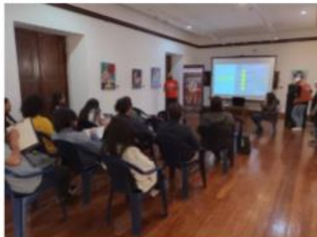
Ponencia 1 - seminario el Cine en mil palabras Casa de la cultura - 12-10-22