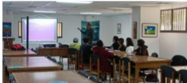
Taller de Guión – 12,13 y 14 octubre de 2022, Banco de la república