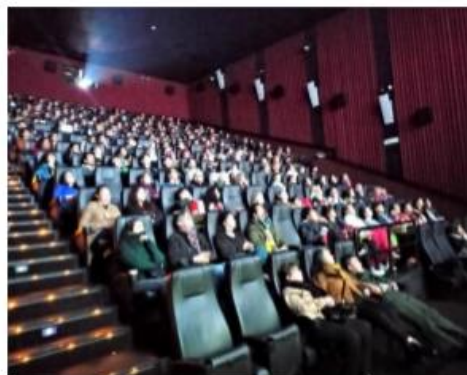
Proyección película inaugural – 11-10-22 Cinemark