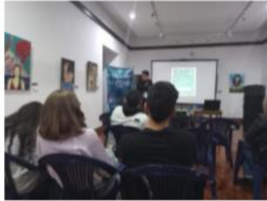
Ponencia 3, cine en mil palabras Casa de la Cultura – 13-10-22