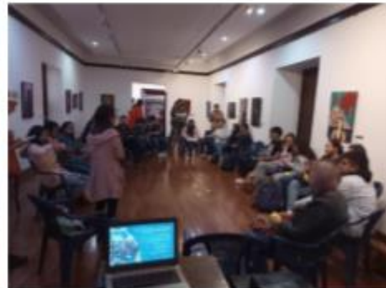
Encuentro de productoras, 13-10-22 Casa de la Cultura