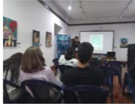
Ponencia 3, cine en mil palabras Casa de la Cultura – 13-10-22