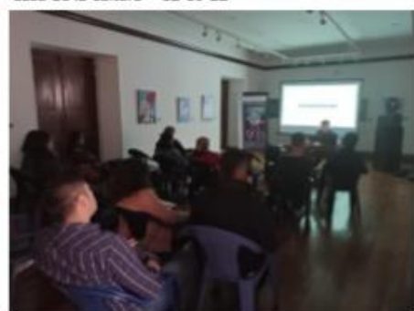
Ponencia 2 - seminario el Cine en mil palabras Casa de la cultura - 12-10-22